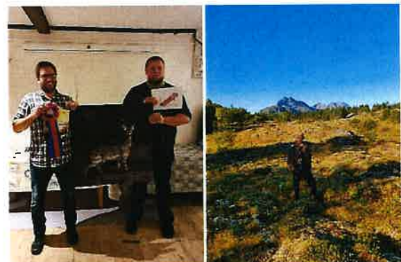
Vinner av Vegaprøven 2020.